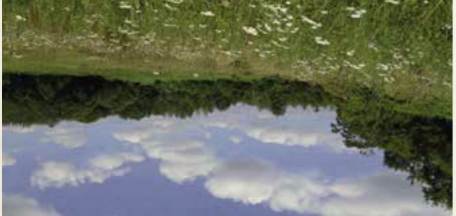
16 Les prairies de Campigny et réserve « Roger Brun » Entre fleurs et papillons

C'est un chapelier de prairies humides situées près du marais des Pâtures en bordure d'Argentan. Les crues d'hiver, la nature tourbeuse des sols, la faible élévation et les nombreux fossés ont permis à la flore quelques espèces odorantes comme le thym ou l'organ ou viennent butiner quantité d'insectes. L'âne et les moutons de Solagne mis en place pour le Conservatoire des espaces naturels de Basse-Normandie entretiennent cette végétation caractéristique. Les Sablonnettes reculent quant à elles, de nombreux fossiles du Jurassique. Informations pratiques : Sentier de découverte / Dépliant-guide. Comment s'y rendre : accès parking route de Putanges à Sentilly. Visites guidées : CPIE des Collines Normandes. Tél. 02 33 62 34 65.