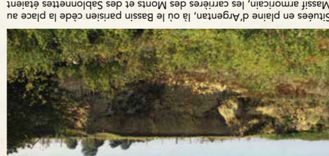
14 Les carrières des Monts et des Sablonnettes Découverte des fossiles du Jurassique

Massif armoricain, les carrières des Monts et des Sablonnettes étaient exploitées pour du sable ou du calcaire. Sur le sol, aujourd'hui, jadis exploitées pour du sable ou du calcaire. Sur le sol, aujourd'hui, jadis exploitées pour du sable ou du calcaire. Informations pratiques : Sentier de découverte / Dépliant-guide. Comment s'y rendre : accès parking route de Putanges à Sentilly. Visites guidées : CPIE des Collines Normandes. Tél. 02 33 62 34 65.