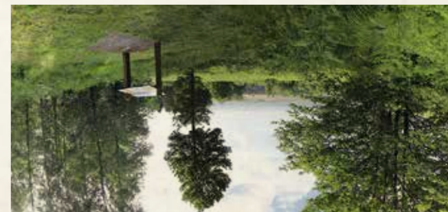
13 Le Site Sainte-Eugénie Vestiges médiévaux et fleurs de légendes

En lisière de la forêt de Gouffern, la motte castrale de Sainte-Eugénie Cephalanthère de Damas sont quelques unes des rares que vous pourrez admirer. Informations pratiques : Sentier de découverte / Dépliant-guide. Comment s'y rendre : accès parking à Sully-en-Gouffern (Gouffern-en-Auge). Visites guidées : Association Faune et Flore de l'Orne. Tél. 02 33 26 26 62.