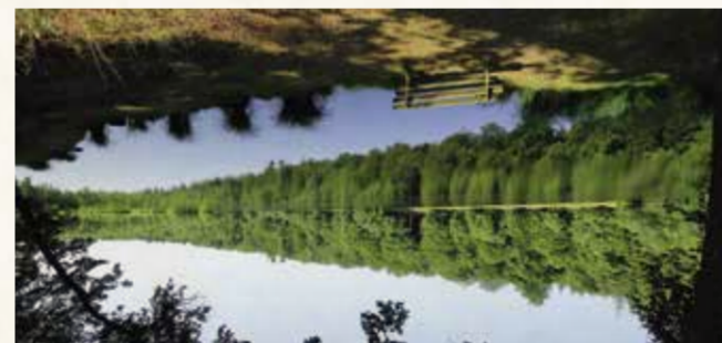
18 L'étang de la lande forêt Un étang en pleine forêt

Au cœur de la forêt départementale du Graisi, l'étang cache une grande diversité. Sur sa rive nord, sauvage et peu perturbée, on y trouve une tourbière et un bois marécageux où s'enchevêtrent les saules dans une atmosphère un peu magique. À la belle saison, un grand nombre de libellules occupe le site et les Droséras (plantes carnivores) fleurissent sur la tourbière. Informations pratiques : Sentier de découverte / Dépliant-guide. Comment s'y rendre : Parking de l'étang de la Lande forêt, Forêt départementale du Graisi. Visites guidées : Parc naturel régional Normandie-Maine. Tél. 02 33 81 75 75.