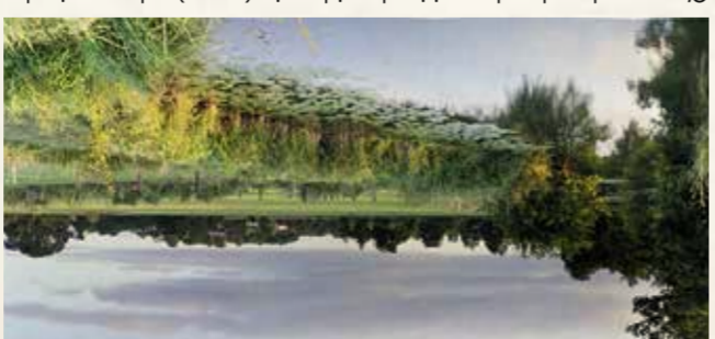
15 La Vallée de l'Orne Au fil de l'eau

Situées en plaine d'Argentan, là où le Bassin parisien cède la place au Massif armoricain, les carrières des Monts et des Sablonnettes étaient exploitées pour du sable ou du calcaire. Sur le sol, aujourd'hui, jadis exploitées pour du sable ou du calcaire. Sur le sol, aujourd'hui, jadis exploitées pour du sable ou du calcaire. Sur le sol, aujourd'hui, jadis exploitées pour du sable ou du calcaire. Informations pratiques : Sentier de découverte / Dépliant-guide. Comment s'y rendre : accès parking à Argentan (2000 m). Visites guidées : mairie d'Argentan. Tél. 02 33 36 40 00.