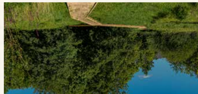
17 La Fuye des Vignes Un pommier vert au cœur de ville

Les crues régulières de la Sarthe l'ont miraculeusement sauvegardée de l'urbanisation environnante, la Fuye des Vignes est une zone naturelle sauvage située entre deux quartiers d'Alençon. Arpentée depuis plus d'un siècle par les naturalistes, ce site bénéficie désormais d'une gestion adaptée pour préserver une biodiversité remarquable, mise en œuvre par la Ville d'Alençon. Informations pratiques : Sentier de découverte ouvert toute l'année Comment s'y rendre : 4 accès possibles : rue du Chemin de la Fuye des Vignes, Boulevard de la République, Rue des Trions et rue de l'Échauffour à Alençon Visites guidées : Association Faune et Flore de l'Orne. Tél. 02.33.26.26.62 / affo@wanadoo.fr