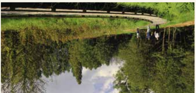
20 Les Vallées et marais de Bretoncelles Partez à la découverte des grands prés !

Situé le long des cours d'eau de la Donette et de la Corbionne et en bordure du bourg, le site est composé d'une mosaïque de milieux humides : prairies, bois marécageux et mar. Un parcours de découverte à vocation pédagogique, accessible à tout public hydrophile et aquatique et aux nombreux insectes présents. Informations pratiques : Sentier aménagé tout public : 1300 m + sentier naturel 1350 m. Comment s'y rendre : accès parking maison de retraite ou parking de la Croix des Chênes (accessibles aux handicapés). Visites guidées : Mairie. Tél. 02 37 37 25 27.