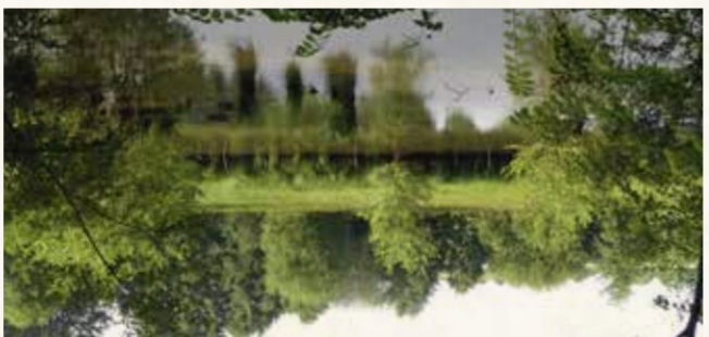
19 L'étang de Saint-Gervais-du-Perron Un concentré de nature

Situé aux limites du Bassin parisien et du Massif armoricain dans un valon humide, l'étang du Perron est bordé de prairies marécageuses et d'un talus boisé. Son intérêt écologique est lié à la végétation hydrophile et aquatique et aux nombreux insectes présents. Informations pratiques : Sentier de découverte / Dépliant-guide. Comment s'y rendre : accès parking à Saint-Gervais-du-Perron (D758). Visites guidées : Parc naturel régional Normandie-Maine. Tél. 02 33 81 75 75.